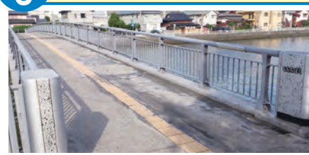
海近くで室見側と百道側とを結ぶ小さな橋です。