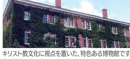
キリスト教文化に視点を置いた、特色ある博物館です。