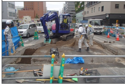
9月18日撮影 (掘削状況)