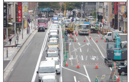
9月18日撮影 (はかた駅前通り占用状況)