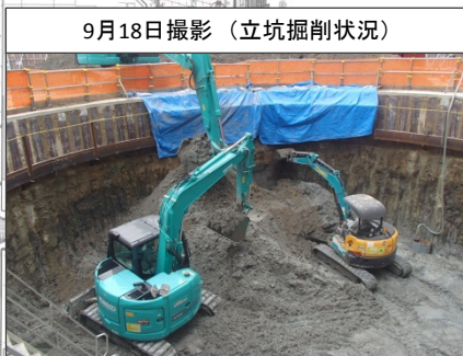
9月18日撮影 (立坑掘削状況)