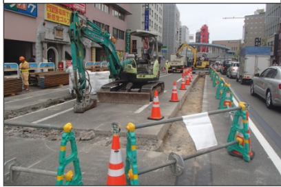
9月18日撮影 (舗装剥ぎ取り状況)