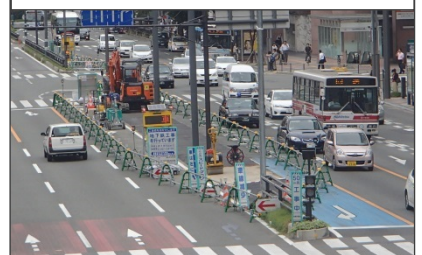
9月18日撮影 (住吉通り占用状況)