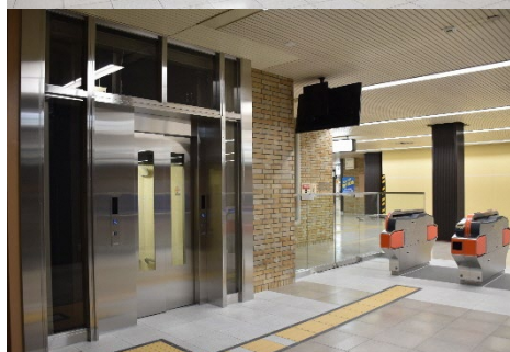
地下1階 筑紫口コンコース