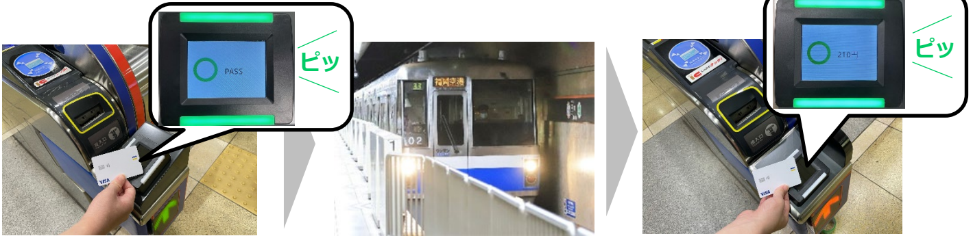
(入場駅にてタッチ)