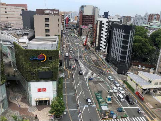
①はかた駅前通りの占用状況 (博多駅側より)