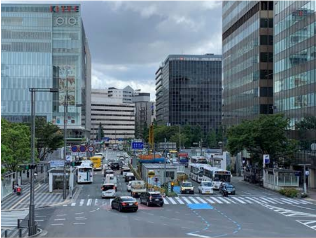
①住吉通りの占用状況 (博多バスターミナルより)