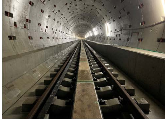
②軌道工事の進捗状況 (東行線・トンネル内)