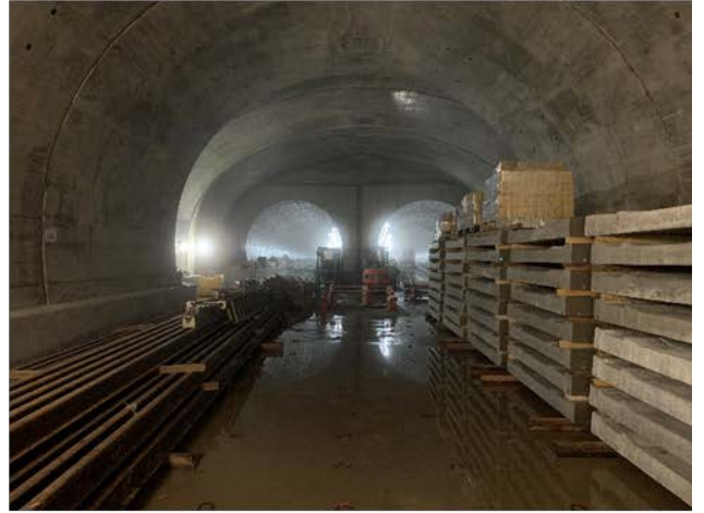
②トンネル構築状況・軌道工事の材料搬入 (大断面トンネル部)