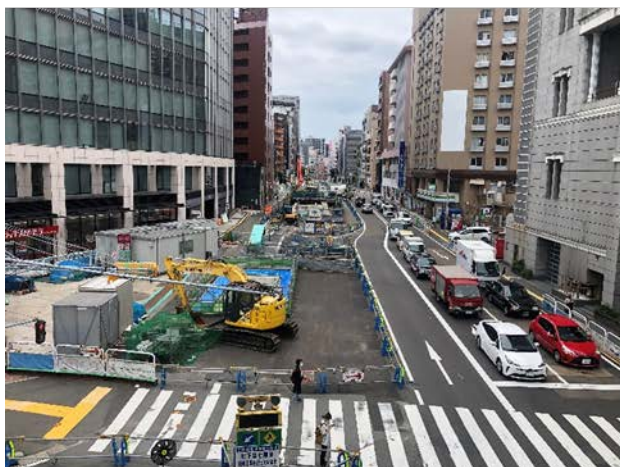
①はかた駅前通りの占用状況 (祇園町西交差点より)