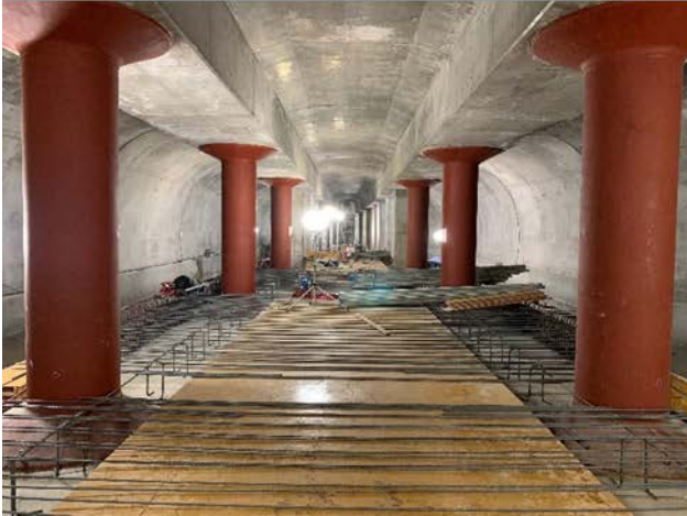
③トンネル構築状況 (3連トンネル部・プラットホーム)