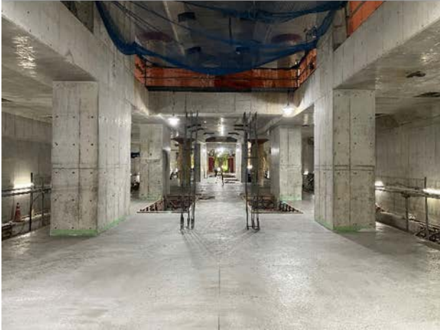
③駅舎部の構築状況 (JR地下街下部：地下5階プラットフォーム)