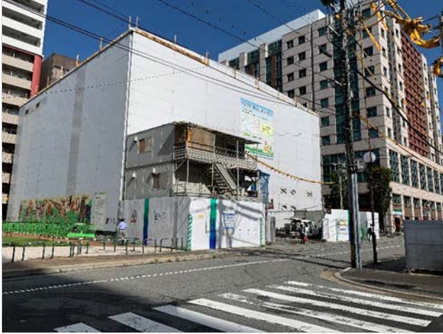
①防音ハウス (明治公園内)