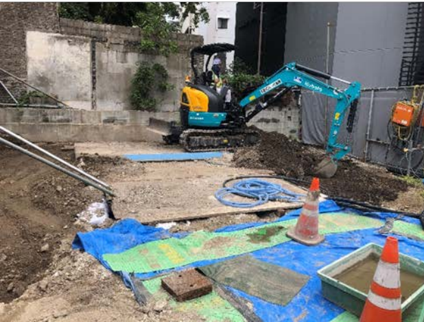
③建築工事の進捗状況 (地上部出入口)