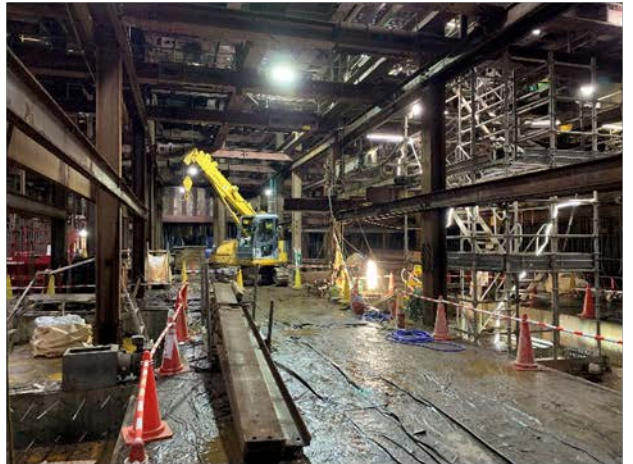
②駅舎部の構築状況 (北側開削部：地下2階)