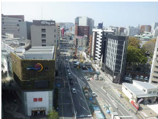
①はかた駅前通りの占用状況 （博多駅側より）