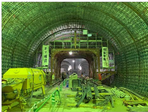
②トンネル構築状況 （標準トンネルⅠ型部）