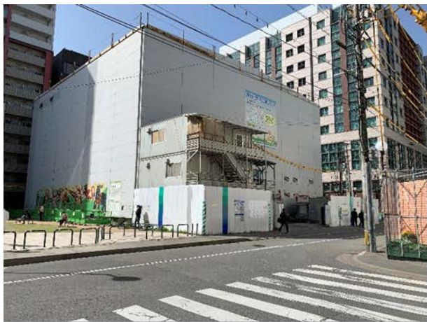
①防音ハウス （明治公園内）