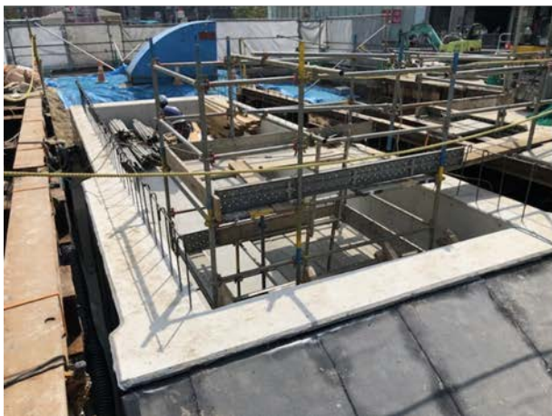
③駅出入口の構築状況 （博多駅側出入口・エスカレーター部）