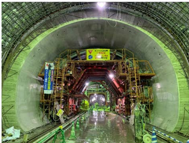
③トンネル構築状況 （標準トンネルⅠ型部）