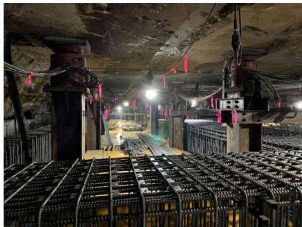
②駅舎部の構築状況 （J R 地下街部：地下4階上床）