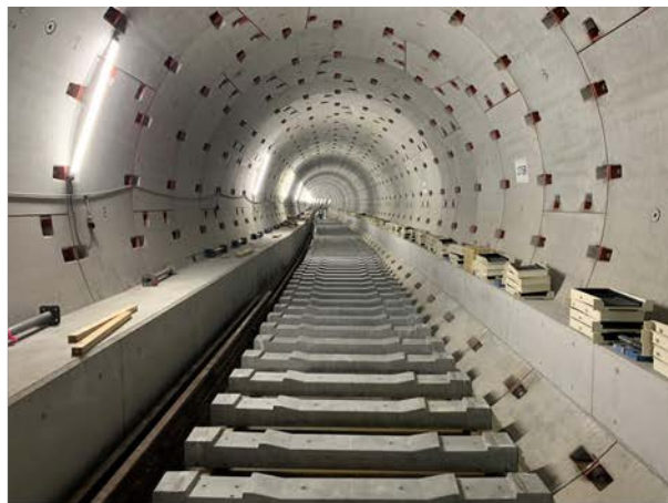
②軌道工事の進捗状況 （東行線・トンネル内）