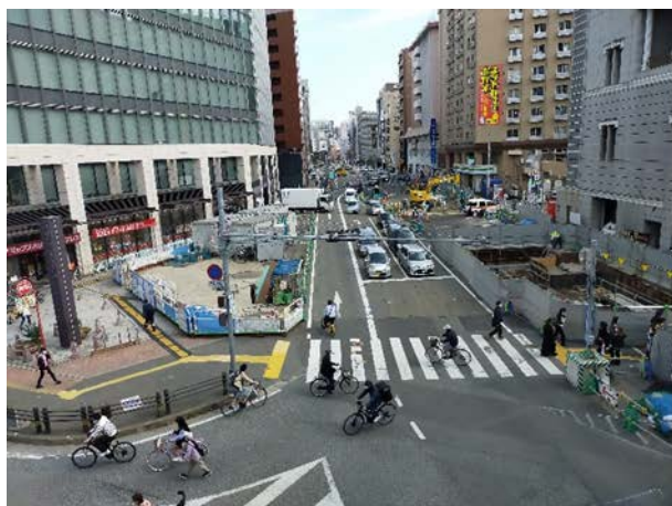
①はかた駅前通りの占用状況 （祇園町西交差点より）