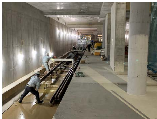
②軌道工事の進捗状況 （駅舎部・地下4階）