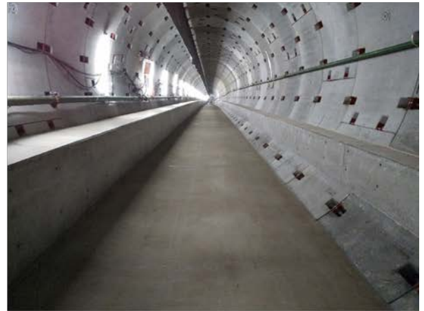
②トンネル内の構築状況 （西行線）