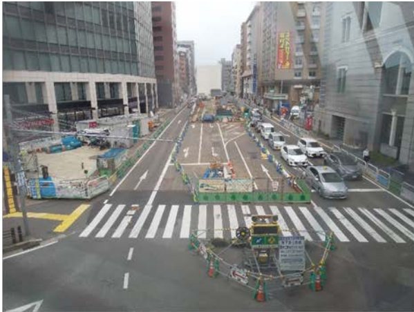
①はかた駅前通りの占用状況 （祇園町西交差点より）