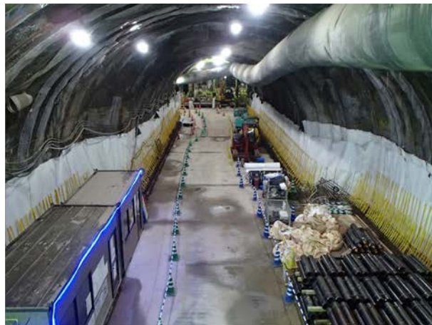
②トンネル構築状況 （標準トンネル I・II 型部）