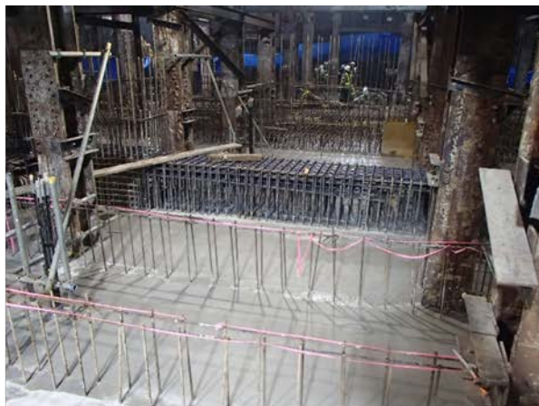
②駅舎部の構築状況 （JR地下街部）