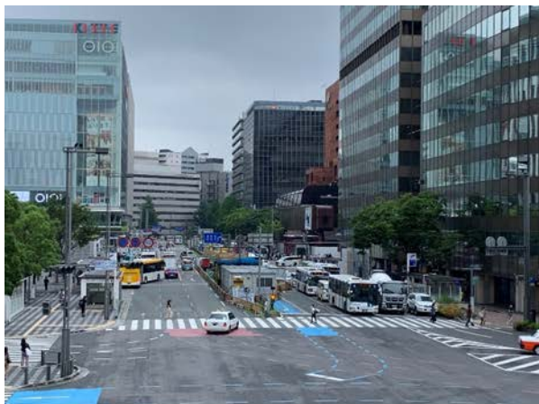
①住吉通りの占用状況 （博多バスターミナルより）