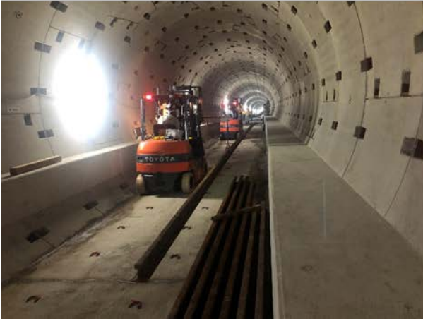
③軌道工事・レール搬入状況 （東行線）