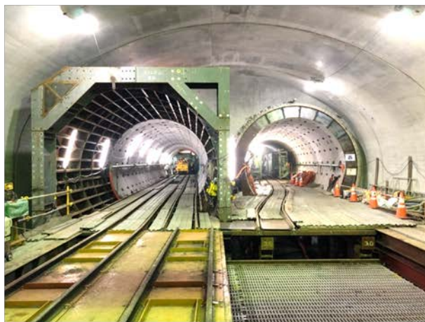
②シールド掘進状況 （西行線：発進坑口部）