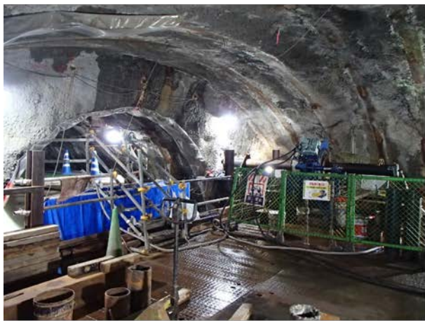
③縦パイプルーフ施工状況 （3連トンネル部）