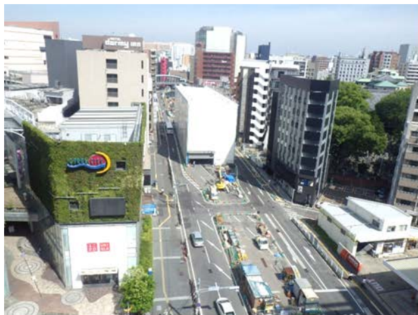
①はかた駅前通りの占用状況 （博多駅側より）