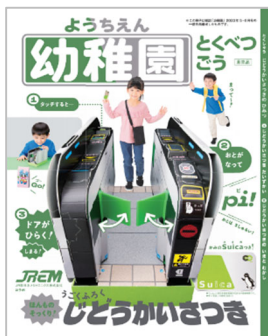
▼ 参加記念品の一例

参加記念品：先着 400 名さまには JR 東日本メカトロニクス(株)提供、小学館「幼稚園」特別号 (改札機工作キット付録付き)、それ以降は交通系 IC カードのキャラクターグッズや鉄道グッズなどから、お一人さまおひとつプレゼントします。