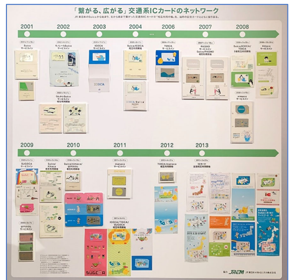
▲ 展示参考イメージ