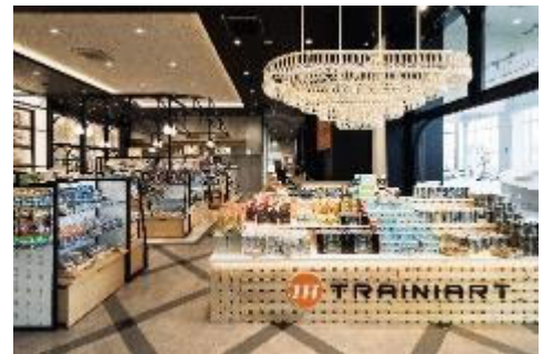
▲ TRAINIART (トレニアート) 店内

鉄道博物館内のミュージアムショップ「TRAINIART (トレニアート)」にて、交通系 IC カード全国相互利用 10 周年を記念して、期間限定で全国の交通系 IC カードキャラクターグッズを販売します。今回の交通系 IC カード全国相互利用 10 周年のために特別制作されたグッズも登場します！ぜひこの機会に、全国の交通系 IC カードキャラクターグッズをお買い求めください。 場所：本館 1 階 ミュージアムショップ TRAINIART (トレニアート)