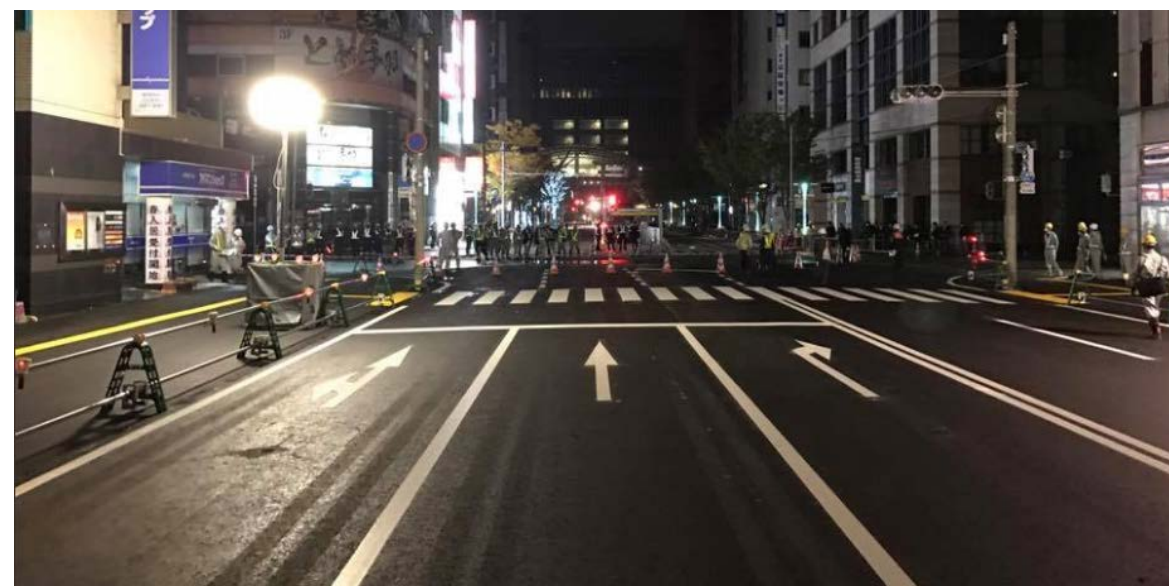
道路開放 (キャナルシティ側から博多駅側を望む)