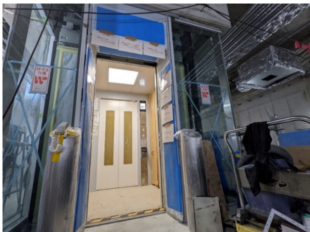
▲ エレベーターの設置状況 <櫛田神社前駅>

櫛田神社前駅及び博多駅では、エレベーター及びエスカレーターの設置工事等を進めています。