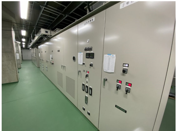
▲ 電気室内の受配電盤設置状況 <櫛田神社前駅>