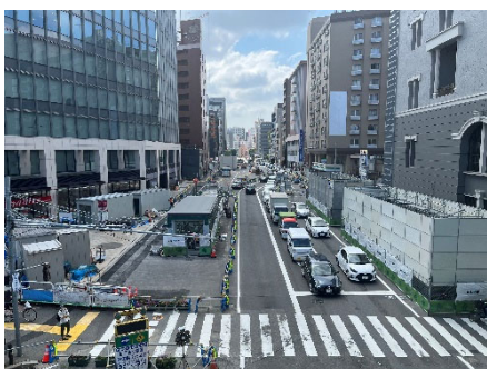
▲【写真①】出入口上屋の進捗状況

櫛田神社前駅では、祇園町交差点の横断歩道橋とエレベーターで接続する出入口等、出入口上屋の構築工事を進めています。