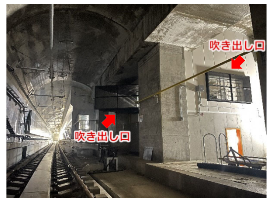
▲ トンネル換気用吹き出し口の設置状況 <博多駅>

地下鉄が走るトンネル内を、換気するための大型ファンを設置する工事を進めています。