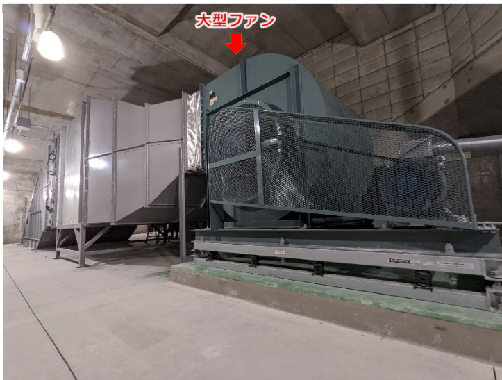
▲ トンネル換気用大型ファンの設置状況 <櫛田神社前駅>

地下鉄が走るトンネル内を、換気するための大型ファンを設置する工事を進めています。