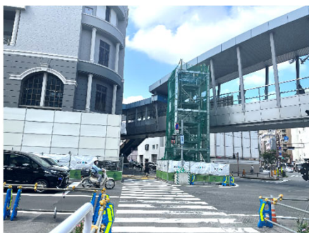
▲【写真②】出入口上屋の鉄骨建方状況