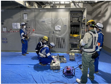
▲ 電気室工事の状況 <博多駅>

新駅に完成した電気室から電気を送りながら、空調設備など各設備の試験調整等を進めています。