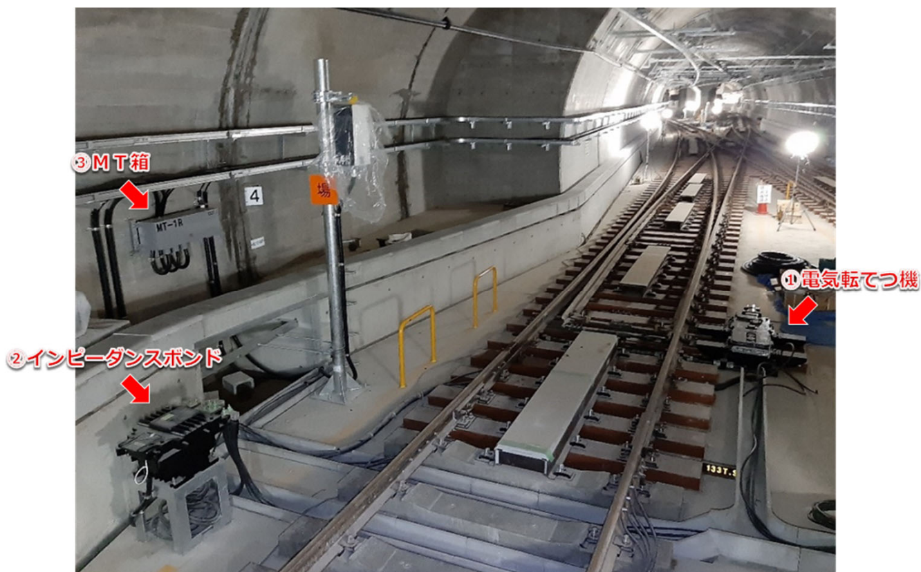
▲ 信号設備の設置状況 <博多駅手前の線路交差部>