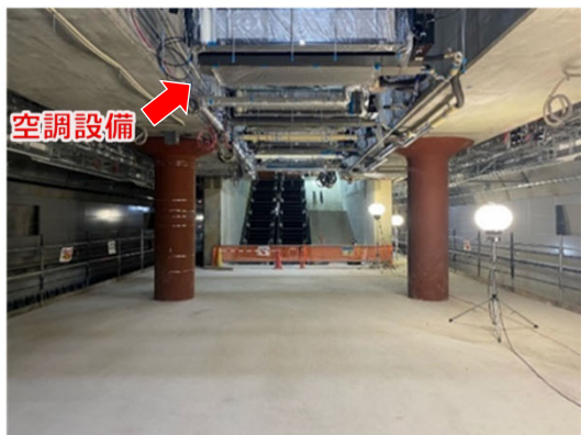
▲ 空調設備設置状況 <博多駅ホーム>

お客様が駅を快適にご利用いただけるように、櫛田神社前駅および博多駅において、ホームやコンコースに、 空調設備の設置工事を進めています。