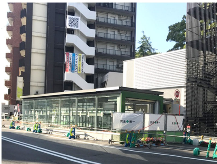
▲ 地上出入口上屋の建築工事状況 <櫛田神社前駅>

櫛田神社前駅の地上では、 出入口上屋の建築工事を進めています。 また、櫛田神社前駅および博多駅では、ホームやコンコースの内装工事等を進めております。