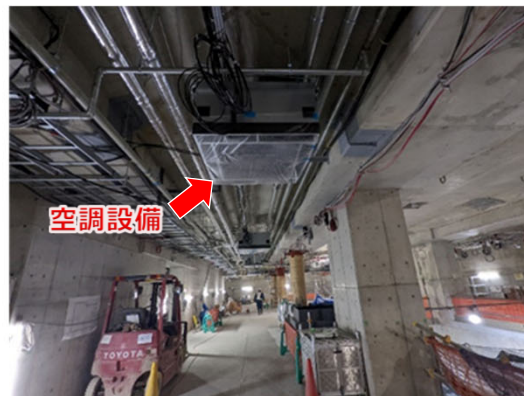
▲ 空調設備設置状況 <博多駅コンコース>