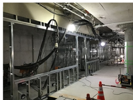
▲ コンコースの建築工事状況 <櫛田神社前駅>