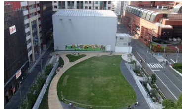
▲防音ハウスの設置状況

近隣への騒音などによる影響を抑制するため、明治公園内の立坑部へ防音ハウスを設置しています。