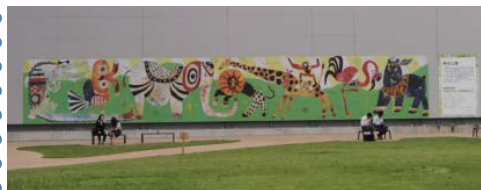
▲周辺景観に配慮した絵(HAKATA-ANIMALS)

防音ハウスの壁面には、地元の皆さんから提案された絵を表示するなど、周辺景観に配慮しています。