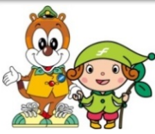
地下鉄マスコットキャラクター「ちかまる」 地下鉄環境キャラクター「メコロ」

福岡市 交通局 建設部 建設課 担当：牧本、日高 電話：092-732-4205 FAX：092-732-4244 MAIL：kensetsu.TB@city.fukuoka.lg.jp