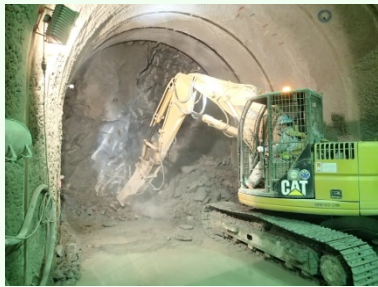
▲連絡坑の掘削状況

■明治公園内に、ナトム工法の立坑(直径約14m、深さ約28m)を掘削完了し、現在は、本坑へ繋がる連絡坑を掘削中。