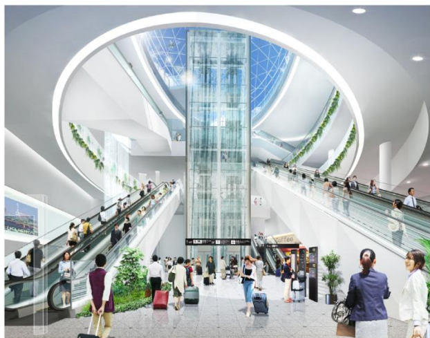
新しい地下ホールのイメージ