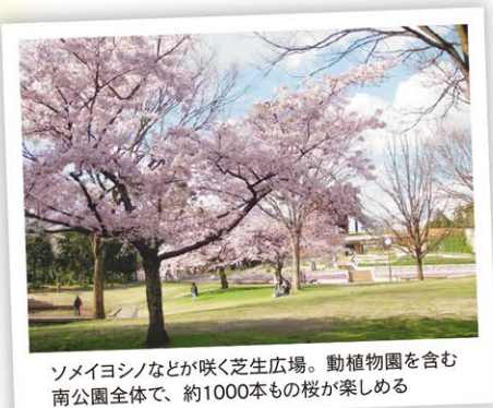
ソメイヨシノなどが咲く芝生広場。動植物園を含む南公園全体で、約1000本もの桜が楽しめる

茶舗 いら江豊香園(いりえほうこうえん) (住) 福岡市中央区舞鶴2-8-12 舞鶴いり江ビル1F Tel.0120(47)1188 https://www.cha-irie.com (営) 9:00~19:00 (休) 土・日曜、祝日 (交) 地下鉄赤坂駅3番出口から徒歩5分