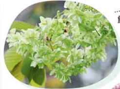
鮮やかな黄緑色が美しい「御衣黄」は4月が見ごろ

大ぶりな八重桜、黄緑色の「御衣黄(ゴイコウ)」などの珍しい品種まで、多種多様な桜が次々と咲く福岡市動植物園。かわいい動物と花のコントラストなど、フォトジェニックなスポットも点在し、散策も楽しめます。3月30日(土)・31日(日)に梅園で「春の茶会」、31日(日)午後1時30分には、先着50組に植物の苗が当たる「さくらのクイズラリー」も開催されますよ。