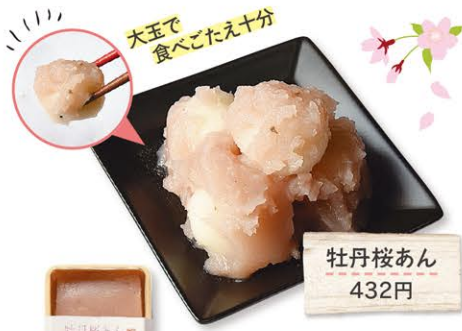
大玉で食べごたえ十分

福岡市動植物園 (住) 福岡市中央区小笹5-1-1 Tel.092(531)1968 http://botanical-garden.city.fukuoka.lg.jp/ (営) 9:00~17:00(最終入園16:30) (料) 600円、高校生300円、中学生以下は無料 (休) 月曜(祝日の場合は翌日) (交) 地下鉄薬院大通駅2番出口から徒歩15分