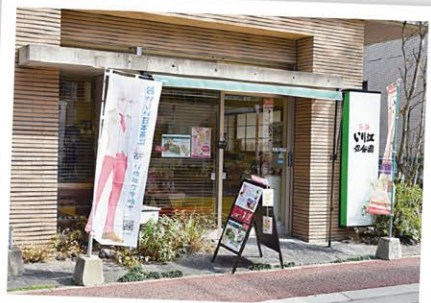
舞鶴公園や西公園にも近い。クッキーシュー(270円)など、オリジナルの抹茶スイーツも販売