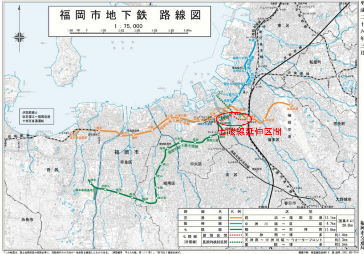
〔福岡市営地下鉄路線図〕