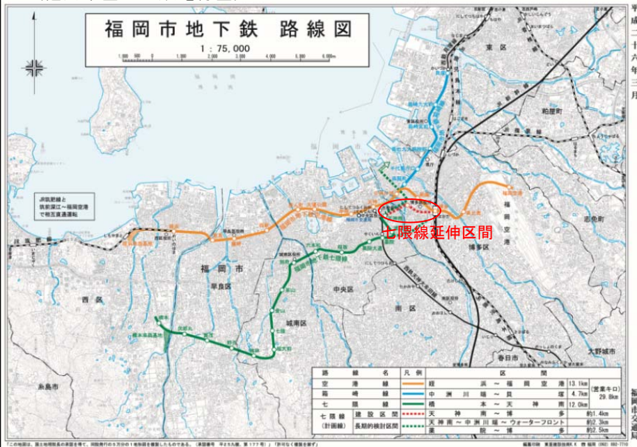
〔福岡市営地下鉄路線図〕